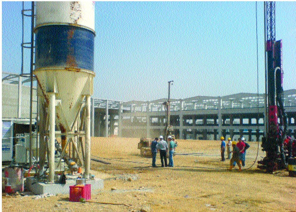
Resim-3: Ön Delgi ve Jet-Grout Uygulamaları

9,0 m'ye ulaşan vasıfsız dolgunun kaldırılarak yerine stabilize dolgu mazlemesinin 40 cm kalınlığında tabakalar halinde yerleştirilmesi ve her kademenin kontrollü bir şekilde sıkıştırılması düşünülmüş, bu sistem fabrikanın 1. kısmında uygulanmıştır. Ancak bu uygulamanın hava koşullarından ve diğer etkenlerden dolayı çok uzun sürmesi ve maliyetinin ön görülen bütçenin üzerine çıkması nedeniyle projenin ikinci etabında tekil temel yüklerinin derin temel sistemi ile kireçtaşı birimine aktarılması planlanmıştır. Derin temel sistemi alternatiflerinden fore kazık, mini kazık ve jet-grout yöntemleri proje için detaylı olarak incelenmiştir. Mini kazık alternatifinde, üst yapı yükleri her temel altında 16 adet 30 cm çapında mini kazıklarla taşılabili-