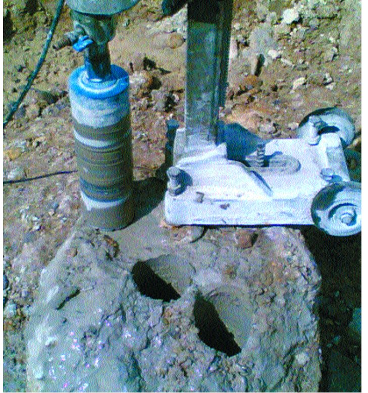
Resim-2: Karot Numune Alımı

lanmamıştır. Değişken dolgu tabakası ve tekil temelleri de içeren sistem en kesiti Şekil 1' de sunulmuştur.