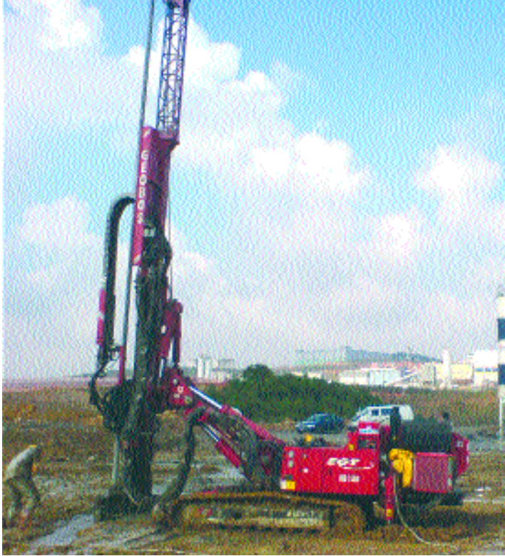
Resim-1: Jet-Grout Deneme Kolonu İmalatı